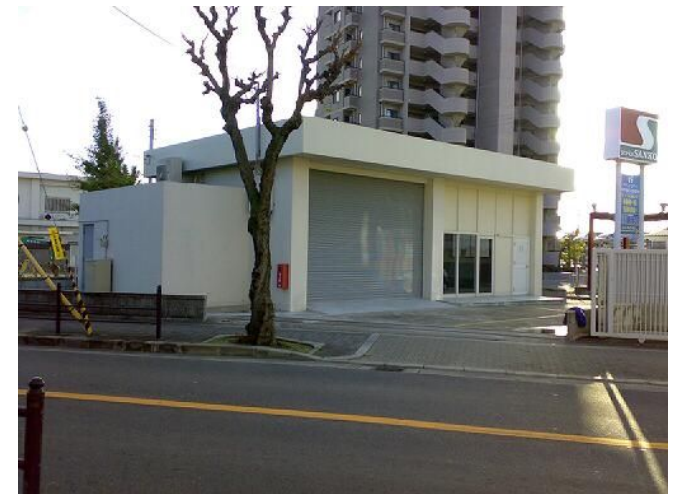
↑ レインボーワーク 前景