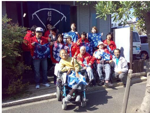
↑ 一泊旅行 (全員)