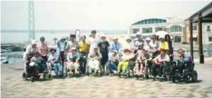
↑ 神戸でクルージング