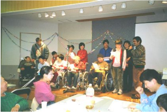
← 昨年のクリスマス会